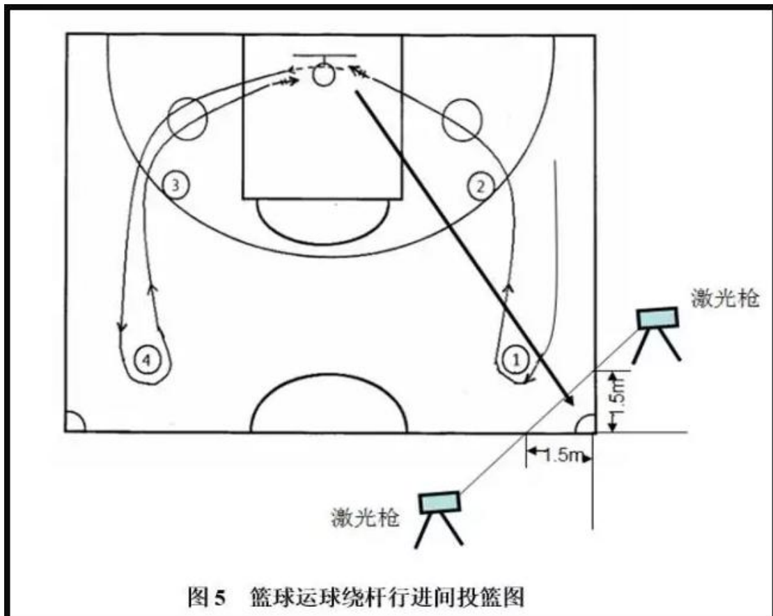
图5 篮球运球绕杆行进间投篮图